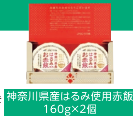
神奈川県産はるみ使用赤飯 160g×2個

令和6年4月1日～令和7年3月31日にお誕生日を迎えられる方にはこちらをプレゼントいたします。