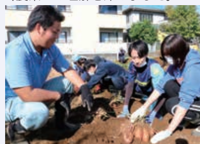
営農担当職員(左)から教わる若手職員

生田地区管内の役職員らが10月16日、同地区の畑で野菜の収穫体験を行いました。この畑は昨年からの地域住民を対象とした食農教育活動で使用していますが、今年は新型コロナウイルスの影響で活動が中止となったため、同地区の若手職員が農業に触れる場として活用。種まきから収穫まで全て職員が行い、農業への理解を深めました。