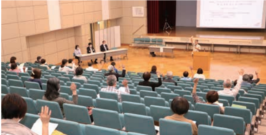
講義を聞く参加者

同講座は今後、市農業技術支援センターやJ Aが管理する畑で、秋冬野菜の栽培管理作業や収穫・片付けなど全9回の講習を、10班