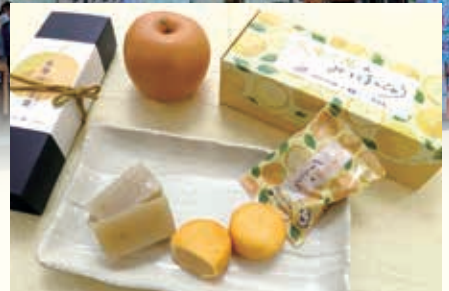
© 1976, 2020 SANRIO CO., LTD. APPROVAL NO. 1.610001