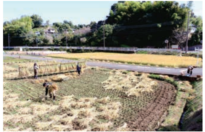
稲刈りの様子(10月 麻生区岡上地区)

るため、お好みの分つき(精米歩合)で購入が可能です。ぜひ一度ご来店いただき、市内産を含む全国各地の新米のおいしさをご堪能ください。