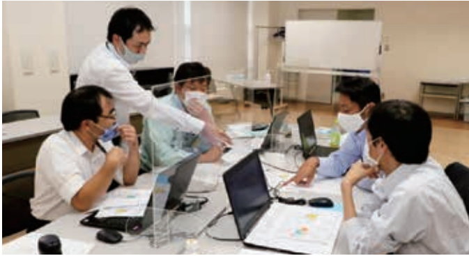
グループディスカッションの様子

J Aでは、各支店で相続シミュレーションや相続についての相談を随時受け付けておりますので、ぜひご利用ください。