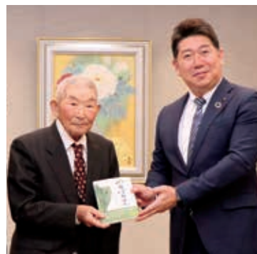
福田市長にのらぼう菜の本を贈呈

また、10月13日には市役所を訪れ、福田紀彦市長に献本しました。高橋さんは「本を出版できてとてもうれしい。これをきっかけに多くの人にのらぼう菜を知ってほしい」と笑顔で話しました。