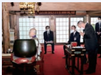
祈りを捧げる森部長

畜産部は10月22日、高津区久末の南林山普門院「蓮花寺」で畜霊祭を行い、部員やJA役職員ら13人が参列しました。川崎大師から同寺院に場所を移して11年目となる畜霊祭は、今年で55回目の開催となります。