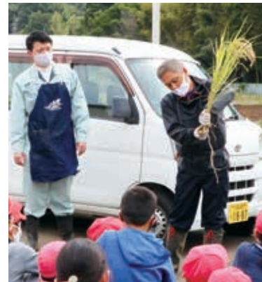
束ね方を教える組合員(はるひ野小学校)

はるひ野小学校では例年、黒川地区の田んぼで、田植えから収穫までの一連の作業を体験していますが、今年の田植えは黒川支部の組合員らが対応しました。稲刈りだけでなく現場を訪れることができた児童は、組合員の指導を受けながら丁寧に作業を進めました。