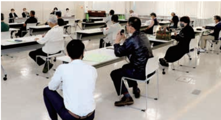
意見交換をする出席者

また、意見交換も行い、出席者からは「市内産農産物の出荷時期が分かるPOPがあれば良いのではないか」「標準価格の設定が必要ではないか」など、多くの意見や要望が出されました。 なお、11月以降も引き続き、出荷者との会議を行います。