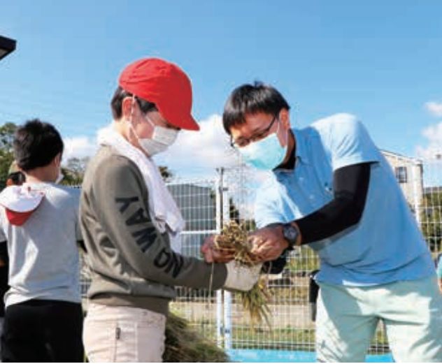
結び方を指導する職員(新町小学校)

JAでは例年、年間60プログラム以上の食農教育活動を展開していますが、今年度は大幅に活動を縮小。栽培品目の都合などで、残念ながらも年度内の活動を断念するものもありましたが、夏頃から再開の相談を受けた学校や保育園などに対しては、十分な感染症対策を講じた上で、職員を派遣するなど徐々に活動を再開しています。