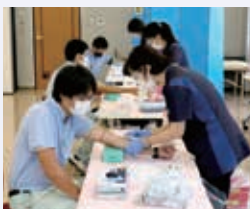
抗体検査を受ける職員

当日は営農経済担当者や生活福祉担当者ら98人が、採血による検査を実施。今後も検査の対象職員を拡大していく予定です。