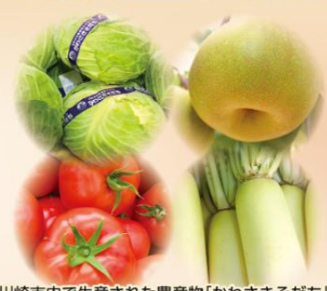
川崎市内で生産された農産物「かわさきそだち」

JAセレサ川崎は、食と農を守り豊かな暮らしの実現をめ ざして、都市農業の振興と地域社会の発展に貢献します。